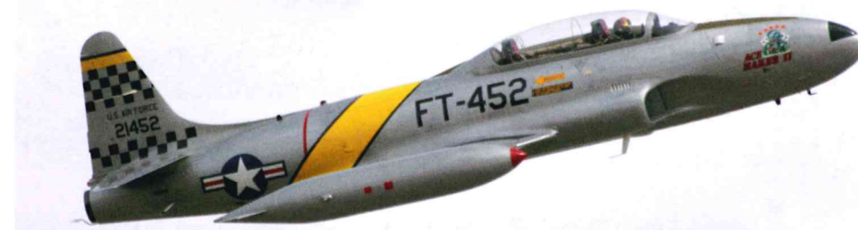
Perfekt restaurierte Lockheed T-33A im Flugprogramm.

Die Joint Force Demonstration simulierte einen Einsatz gegen „feindliche Kräfte“, die einen U.S. Stützpunkt angriffen. Zunächst drängten die F-22 gegnerische Flugzeuge (F-16) aus dem Luftraum und flogen dann Angriffe auf Bodenziele. Anschließend setzte eine C-17