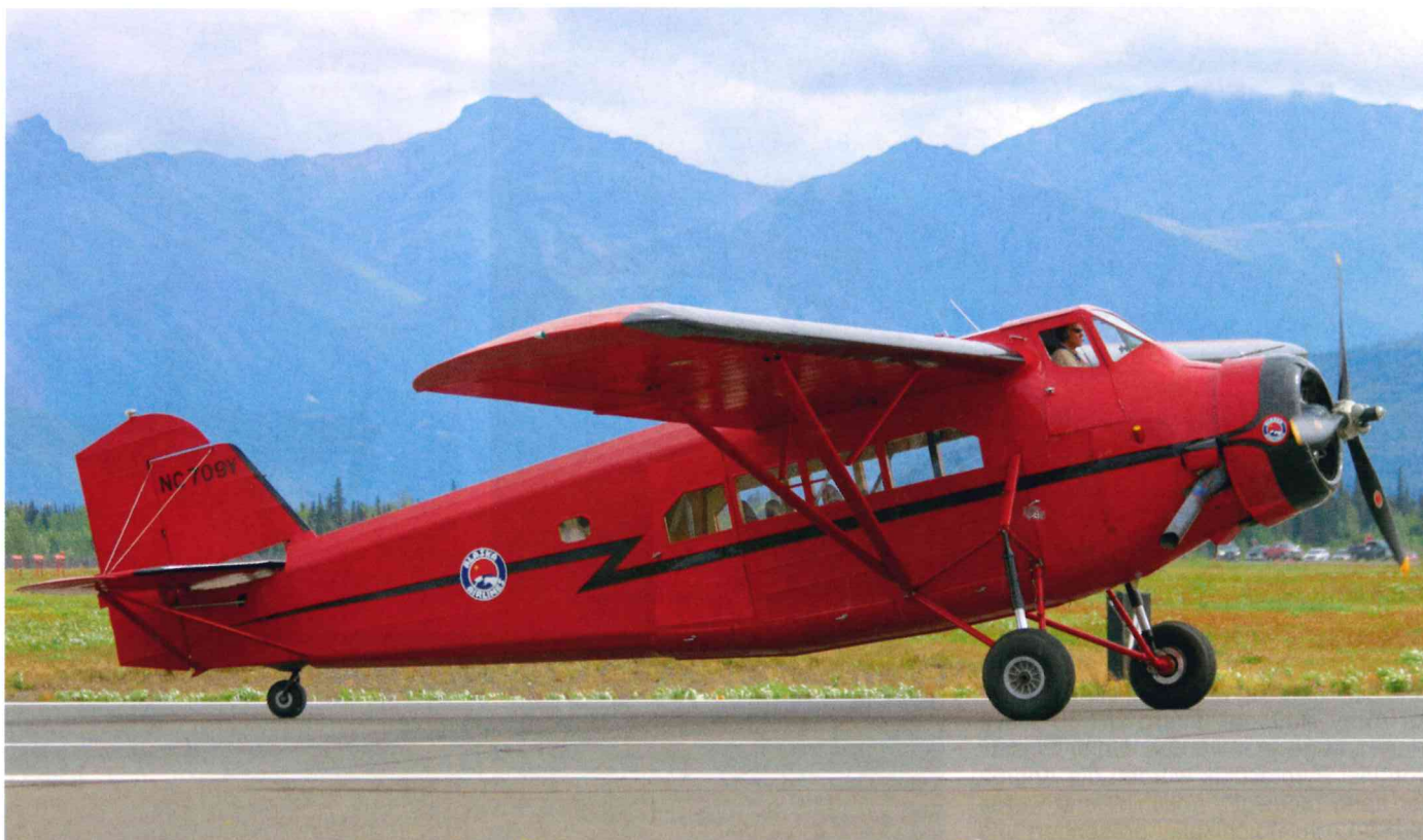
Fairchild 100 A in den Farben der Alaska Airlines.